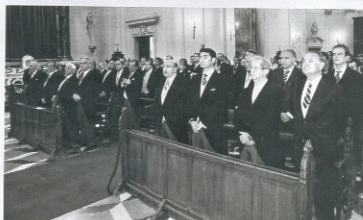
Los testigos del novio, imagen de la izquierda, y de la novia, imagen de la derecha, en un momento de la ceremonia religiosa